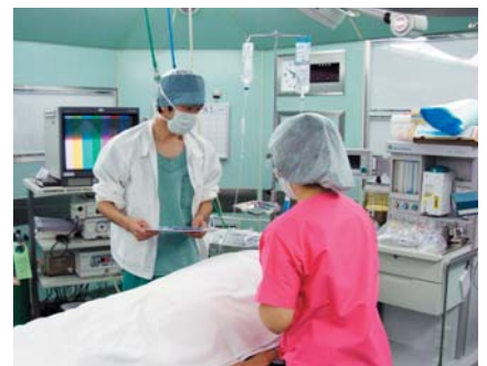
患者様とともに確認中▶

手術をされる患者様の安全を確保し安心して手術を受けて頂くために入室時、患者様と看護師で名前・誕生日の確認を行っています。また、手術が始まる前には、医師と患者様と看護師でもう一度予定している手術について説明し確認しています。患者様からは安心して手術が受けられるという声をいただいています。