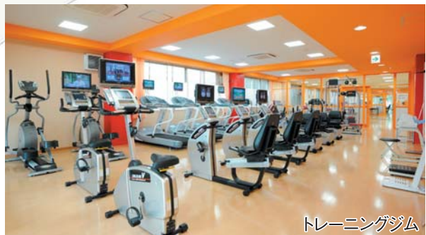
トレーニングジム