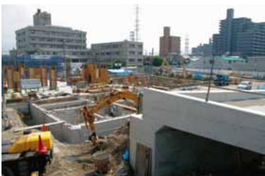
左上から現病院、躯体工事、基礎工事、進入路工事