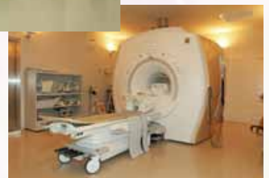
MRI装置 (1.5T) Optima MR360 Advance▶