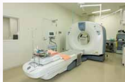
▲CT装置 (64列) Optima CT660 Pro