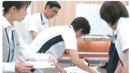
▲災害時対応訓練の様子

11月には今回の災害時対応訓練の経験をいかして、大規模災害を想定した受け入れ訓練を行います。いつ発生するかわからないのが災害です。いざというときに、地域から求められる医療を継続して提供できる病院となるよう、今後も訓練と学習を続けていきます。