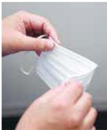
① ノーズピース部分に折り目を付ける。裏表を間違えないよう注意

時々、マスクから鼻を出していたり、顎に引っかけたりしている方を見かけます。間違った着用方法ではマスクの効果が失われますから、正しい着用方法を身に着けましょう。まずは、鼻腔からウイルスが入る可能性があるため、鼻は必ずマスクの中に収めて、顎までしっかりと覆います。この時に隙間をつくらないようにするのが大切。難しければ、耳の後ろでゴムを引っ張って結びと隙間ができにくくなります。マスクを外す際、表面にはたくさんのウイルスが付着しています。表には触れず、耳のゴムのところを持って外して下さい。その後、手洗いも忘れずに。広島共立病院では、1階の売店と、2階夜間入口の自動販売機でマスクを販売しています。必ず着用するよう心がけてください。