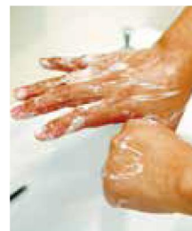
② 親指をクルクルと回して洗う。手の平や指の先も念入りに。