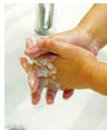
① 手を濡らして石鹸で泡立て、手の甲と指の間をモミモミと洗う。

病気を引き起こす感染症の多くは、電車の吊り革、手すり、エレベーターボタン、ドアノブなど多くの人が触れる物品を介して広がっていきます。見た目には汚れていなくても、ウイルスがびっしり付着している可能性大! 外出から帰った時や食事前など、石鹸と流水できれいに洗い流す習慣を身に着けましょう。手洗いのポイントは、手の平や甲だけでなく、指の間や指の先、手首まで30~60秒かけて洗うこと。濡れたままの手は菌を運びやすくなるので、ペーパーなどでしっかりと拭いてください。小さなお子さんには、手洗いを歌でレクチャーする動画を見せるなどして、楽しく覚えられよう工夫しましょう。