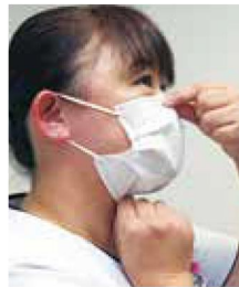
③ 蛇腹を顎の下まで伸ばして、鼻と口をぴったりと覆う。