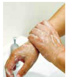
③ 手首までしっかりと洗って流す。水気を残さないようきれいに拭こう。

「自分の体はもちろん、身近な人を守るためにもマスク・手洗いで予防が重要。ぜひ実践してみてください!」