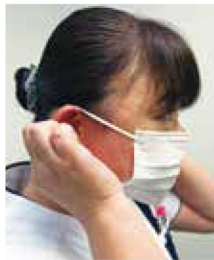
② ゴム紐を耳にかける。ブリーツが下向きになっていればOK。