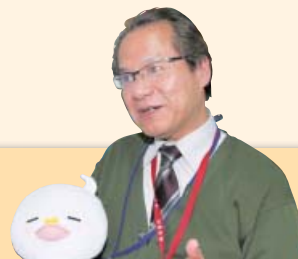
▲HMネットのマスコットキャラクター「ぼぼじろう」