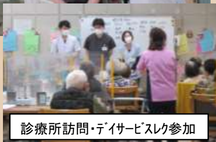
診療所訪問・デイサービスレク参加