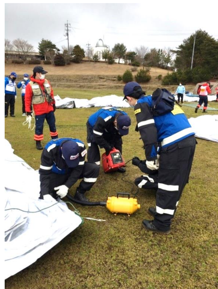
↑ DMAT 災害実働訓練 の様子

地域での班会 学会や勉強会への参加 健康チェック・薬の相談（コロナに伴い中止中）