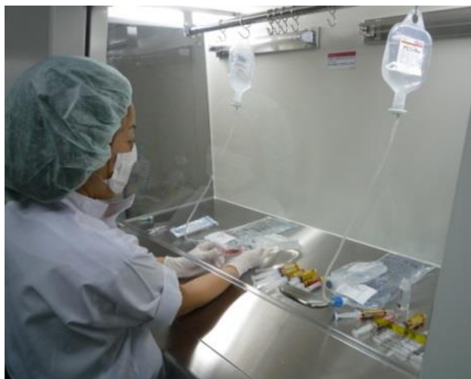
↑ 高カロリー輸液混注の様子