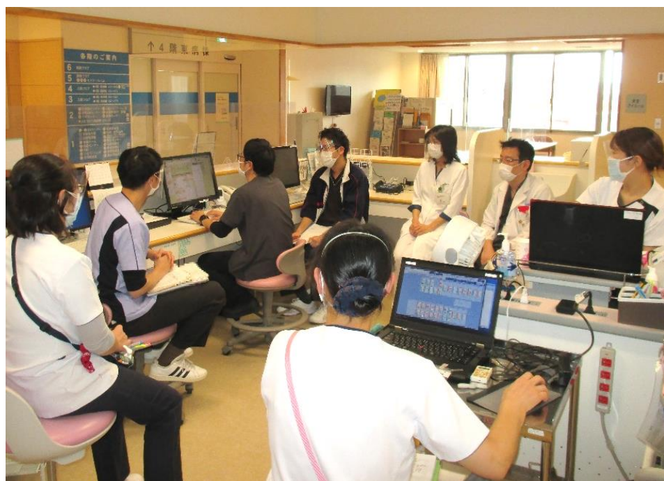
↑ 病棟カンファレンスの様子