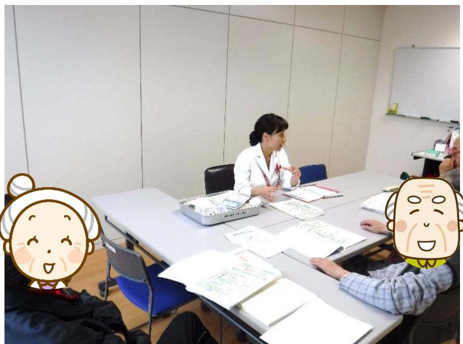
↑ 糖尿病教室での指導の様子