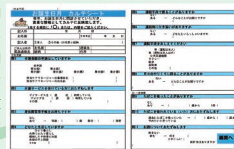
お誕生日月問診票

皆様の医療機関で気になる方がおられましたら、当院相談室にご一報下さい。MSWが相談・支援させていただきます。