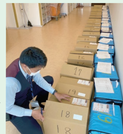
連携型施設へのワクチンと資器材の配送準備

一方、連携型接種施設へのワクチン配送作業も日々続いています(写真)。5月末で連携型108施設(延125施設)、1852バイアルの搬送が完了予定です。住民接種では、この流れがなくなりますので搬送作業が終了となります。