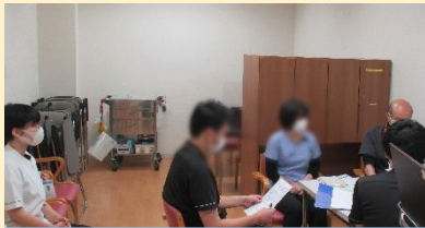
病棟カンファレンス