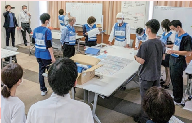
訓練での災害対策本部ミーティング